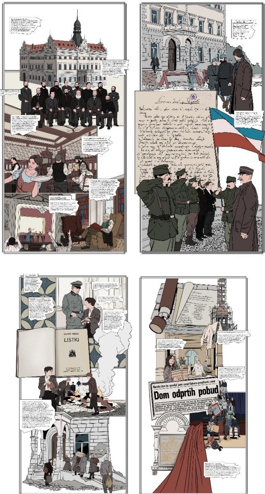
Slika 6, 7, 8, 9: Razstava Narodni dom Maribor – središče kulturnega dogajanja od 1899, 2022, avtorja razstave: Gašper Krajnc in Špela Valadžija