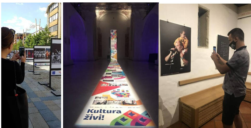
Slika 3: Razstava Iz sivega v barve, 2022, foto: Tadeja Nedog

Gostovanja razstav in recikliranje estetskih in vsebinsko bogatih razstavnih elementov so se izkazala za dobro prakso, da razstave delno ali v celoti ponovno zaživijo izven razstavišč v okoljih, ki v osnovi niso namenjena tovrstnemu predstavljanju (npr. trgi in ulice, izložbe, nakupovalna središča, dijaški oz. študentski domovi, raznovrstni dogodki), in omogočijo stik s preteklostjo tudi tistim, ki ne obiskujejo klasičnih razstav. V teh primerih si naključni obiskovalci vzamejo čas in z zanimanjem preučijo predstavljeno vsebino, s tem pa se tudi izvajata izobraževanje in promocija arhivskega gradiva ter dejavnosti arhivov.