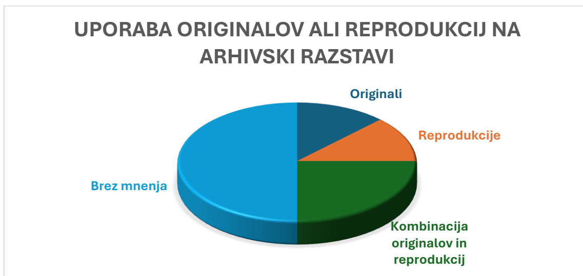
Graf 1: Uporaba originalov ali reprodukcij na arhivski razstavi

Nestrinjanje strokovnjakov se je pojavilo bolj pri pogledu na arhivske razstave kot pri predlogih za preoblikovanje vprašalnika. Morda se tukaj nakazuje tudi, kje se bodo pokazale razlike sodelujočih v anketi. Do povsem uravnoveženega mnenja je prišlo glede vprašanja, ali je bolje razstavljati originale ali reprodukcije arhivskega gradiva. Ena oseba je mnenja, da je treba uporabljati originale, ena reprodukcije, dve osebi, da je najboljša kombinacija obeh, štiri osebe pa se glede te teme niso opredelile (Graf 1).