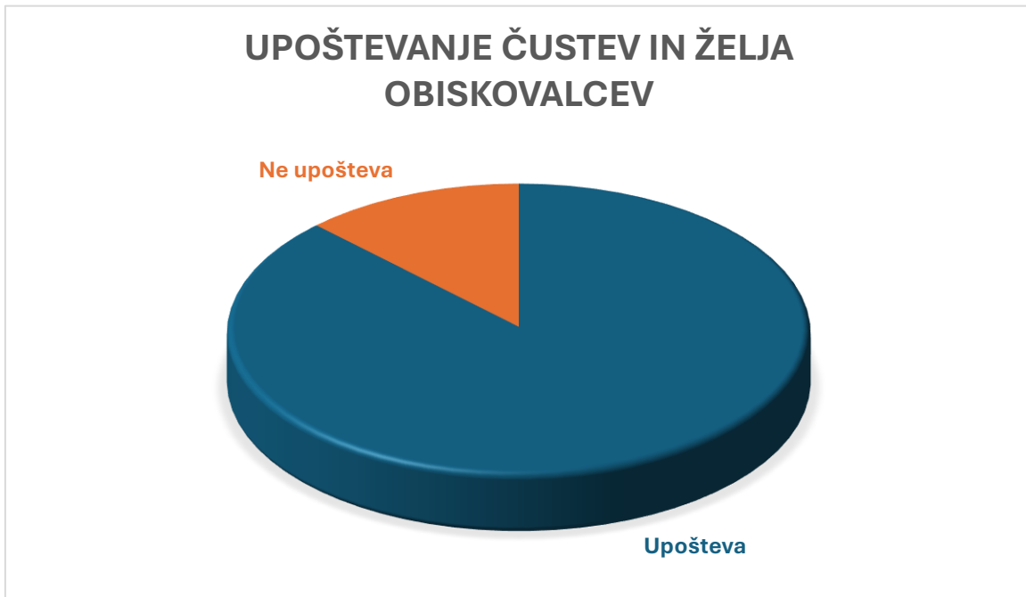
Graf 3: Upoštevanje čustev in želja obiskovalcev

Najbolj očitno nestrinjanje sodelujočih v delfski študiji se je izkazalo pri tem, ali avtorje razstav zanimajo čustva in želje obiskovalcev. Sedem sodelujočih svoje razstave pripravlja tako, da imajo v mislih čustva in želje obiskovalcev, ena oseba pa se za to ne zanima (Graf 3).