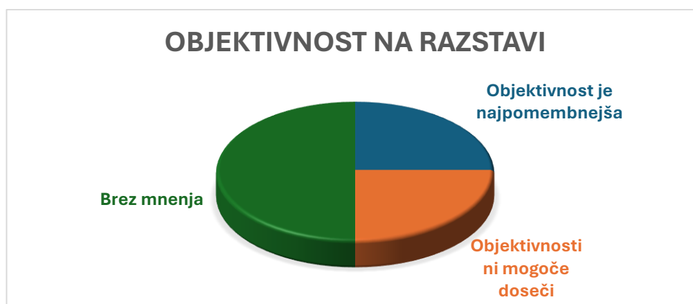
Graf 2: Objektivnost na razstavi

Povsem uravnoveženo je bilo tudi mnenje v zvezi z objektivnostjo pri interpretaciji zgodovine in prikazu na razstavi. Dve osebi sta poudarili velik pomen objektivnosti, zaznati je bilo mnenje, da ocenjujeta, da bi znale emocije negativno vplivati na ta faktor, dve osebi sta bili mnenja, da se absolutne objektivnosti kljub prizadevanjem ne more doseči, štiri osebe pa se niso opredelile o tej temi (Graf 2).