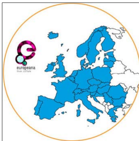
Slika 4: Partneri APEX projekta

U Projektu APEX uzelo je dosad učešće ukupno 33 partnera iz 32 zemlje (videti sliku 4). Srbija je u Projektu prisutna putem nedavnog predavljanja digitalnih sadržaja Istorijskog ahiva Beograda . Potrebna dokumentacija za pristup APEX projektu i Sporazum o razmeni podataka su potpisani, kako sa Kancelarijom APEX-a, Nacionalnim arhivom Holandije, tako i sa Europeanom. Sva dokumentacija je dakle kompletirana, a Istorijski arhiv Beograda se registrovao i kod Evropske komisije za projekte pod pokroviteljstvom EU, te se sad može raditi i na sledećim koracima, od kojih je jedan svakako i predavljanje digitalnih sadržaja. Za sada se, na portalu Projekta i u direktorijumu arhiva, mogu naći podaci o Istorijskom arhivu Beograda (preko linka dostupnog na web stranici http://www.arhiv-beograda.org/index.php/rs/ , Internet 4).