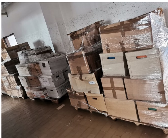
Slika 10: Palete gradiva, pripravljene na selitev

V aprilu 2021 se je pričelo pakiranje gradiva na palete, kar je omogočilo lažji prevoz na novo lokacijo.