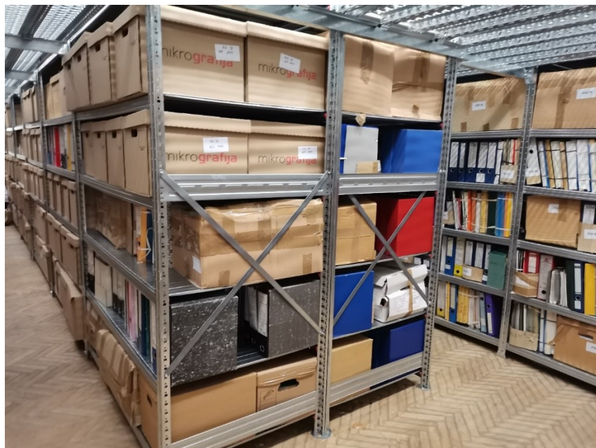
Slika 13: Gradivo v novih prostorih