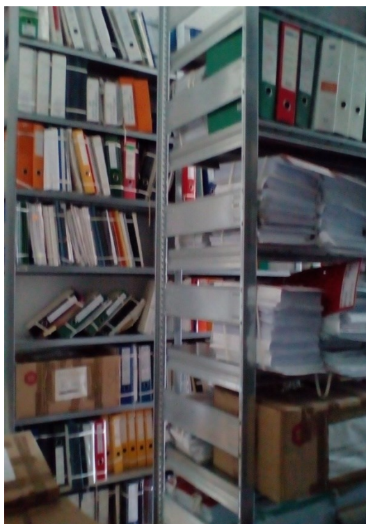
Slika 3: Natrpan regal v 1. nadstropju

Ob selitvi so gradivo najprej odlagali v 1. nadstropje, kjer so bili prostori delno opremljeni s fiksnimi regali, visokimi cca. 2,5 m. Te regale so napolnili do zadnjega centimetra, da vanje ni bilo moč dodajati gradiva. Del gradiva so preselili in pustili v škatlah med praznimi regali, ki so zaradi tega postali neuporabni.