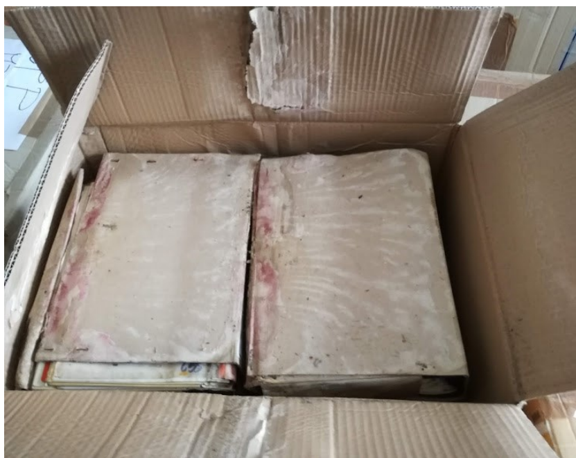
Slika 7: Gradivo oz. škatle so onesnažene z iztrebki ali namočene ob poplavih