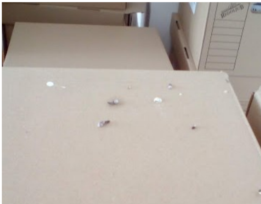
Slika 8: Med škatlami se najdejo tudi kadavri ptičev, netopirjev ...

Vsi ti neustrezno urejeni prostori in dejavniki so ogrožali zdravje zaposlenih, ki so skrbeli za arhiv MOP, in bili povod za idejo o spremembi, o ureditvi in selitvi arhiva MOP v primernejše prostore. Le na tak način bi lahko poskrbeli tako za ustrezno hrambo dokumentarnega in arhivskega gradiva kot tudi za zdravje zaposlenih.