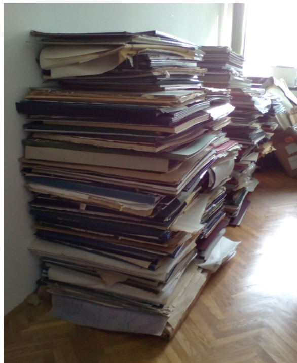
Slika 5: Nepravilno odloženi Državni prostorski načrti (DPN)

Gradivo je bilo odloženo v 36 prostorih vojašnice. Del gradiva je bil odložen mešano, brez vedenja o načinu odlaganja. Ponekod je bilo okvirno znano, kakšen je bil način odlaganja, gradivo je bilo zloženo v škatlah, drugje je bilo v prenatrpanih visokih regalih. Pri iskanju gradiva je bila v pomoč mala, razmajana gospodinjstva lestev.