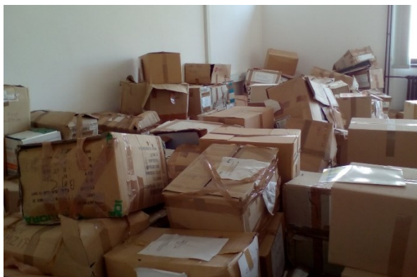
Slika 2: Škatle v eni izmed sob pritličja

Ob selitvi so gradivo najprej odlagali v 1. nadstropje, kjer so bili prostori delno opremljeni s fiksnimi regali, visokimi cca. 2,5 m. Te regale so napolnili do zadnjega centimetra, da vanje ni bilo moč dodajati gradiva. Del gradiva so preselili in pustili v škatlah med praznimi regali, ki so zaradi tega postali neuporabni.