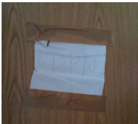
Slika 1: Napis na vratih pritličja