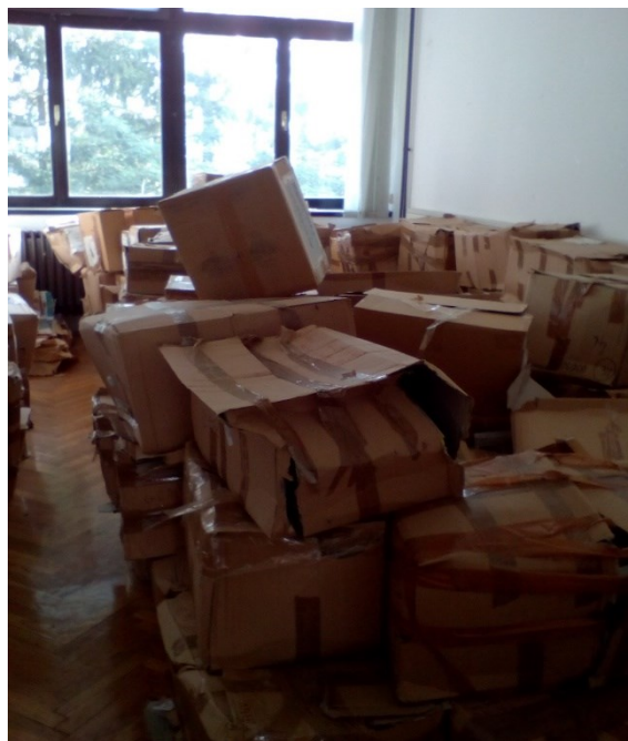
Slika 6: Razmetane škatle gradiva v eni izmed sob