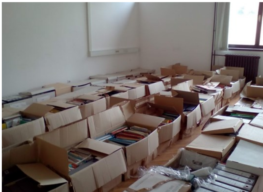
Slika 4: Na tla položene škatle neurejenega gradiva

Gradivo je bilo odloženo v 36 prostorih vojašnice. Del gradiva je bil odložen mešano, brez vedenja o načinu odlaganja. Ponekod je bilo okvirno znano, kakšen je bil način odlaganja, gradivo je bilo zloženo v škatlah, drugje je bilo v prenatrpanih visokih regalih. Pri iskanju gradiva je bila v pomoč mala, razmajana gospodinjstva lestev.