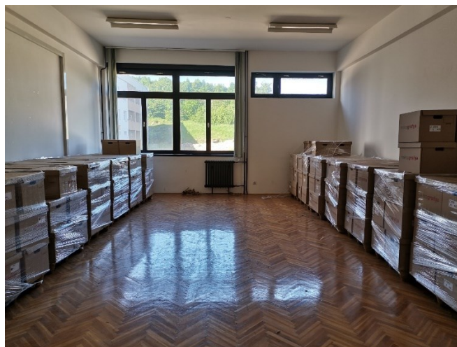
Slika 12: Celotno gradivo je pripravljeno za prevoz iz vojašnice na Stari Vrhniki na novo lokacijo arhiva

21. 4. 2021 je datum, ki smo ga vsi sodelujoči neizmerno čakali. Dan, ko so se prve palete gradiva odpeljale v nove prostore.