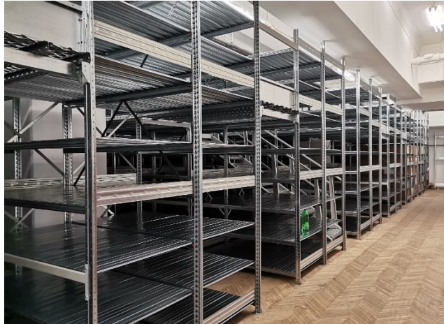
Slika 11: Postavljeni regali v novih prostorih

Z nekajdnevnim zamikom so se v novih prostorih pričeli postavljati odlagalni regali s fiksnimi podesti in pritrjenimi stopnicami. Ko so bili postavljeni, je novi prostor dobil podobo »pravega« arhiva.